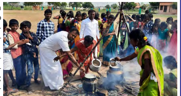
Pongal: festa del raccolto. India