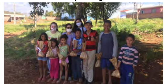
Visitando i quartieri poveri