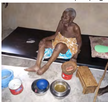
Donna di 102 anni è sola nel villaggio di Sääba, nella sua casa ricostruita dalla FPT.

FPT opera sulla base di donazioni in natura e in denaro offerte da uomini di buona volontà e studenti dei Fratelli della Sacra Famiglia. Un giovane apostolo della Sacra Famiglia anima la vita del FPT nelle istituzioni, nei villaggi e nelle città del Burkina Faso. Le varie donazioni costituiscono un fondo gestito da un Ufficio Nazionale in collaborazione con l'Economista Provinciale.