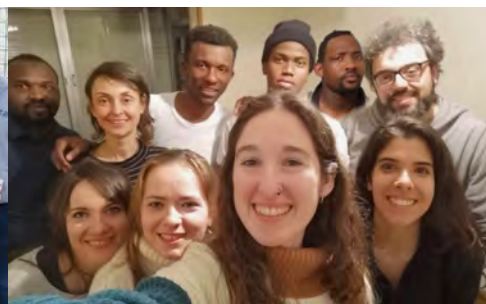
Con gli immigranti a "Casa Nazareth"

Nel numero precedente abbiamo descritto le principali attività della ONG Carumanda dirette ad altri Paesi. Le iniziative di solidarietà che si realizzano con gli studenti dei Centri della Provincia, e in altri luoghi dove c'è bisogno di aiuto, sono organizzate e realizzate attraverso la stessa ONG, i Dipartimenti di Pastorale, le Comunità e le Fraternità. Anche nei Centri in Ecuador e nella Comunità di Bucaramanga (Colombia) c'è una sensibile attività di solidarietà. In diversi centri ci sono gruppi come Carumanda per giovani e ragazzi e gruppi di solidarietà a Puyo e Ambato