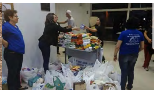
Distribuendo il cibo