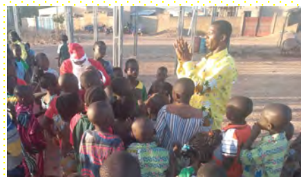
Un Fratello celebra la festa della Santa Famiglia con i bambini sfollati.