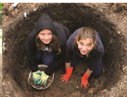
Scavando un pozzo