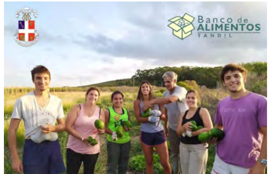
Orto della solidarietà