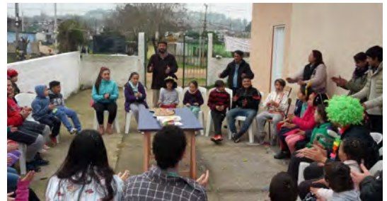
Animazione e ricreazione con i bambini

Brasil. Ibema. "Dona un giocattolo, procura un sorriso". Aiutare le famiglie in difficoltà.