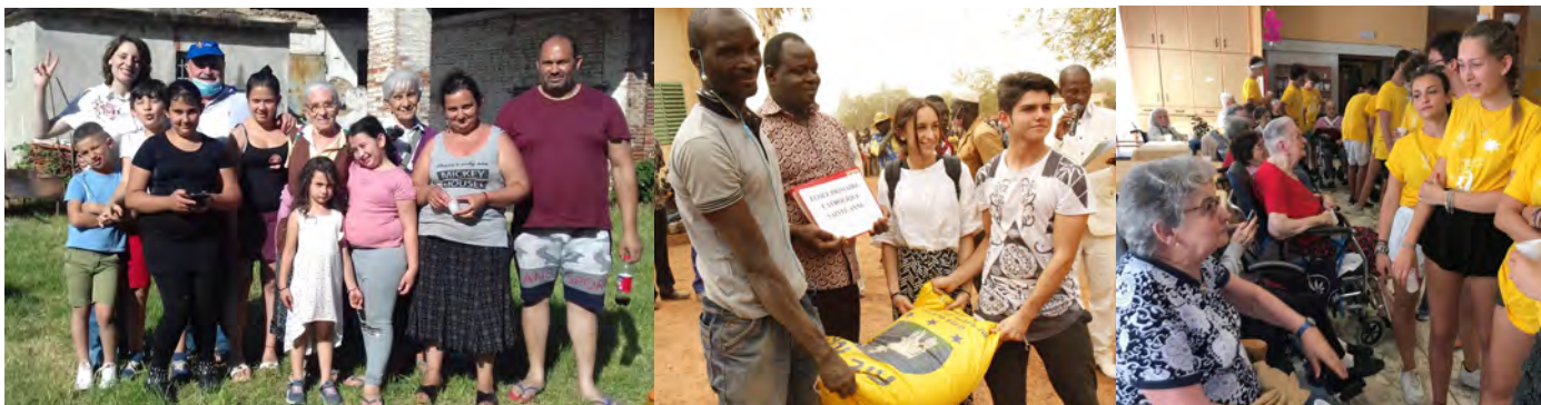
Con una famiglia Rom appena sistemata in una casa di campagna.