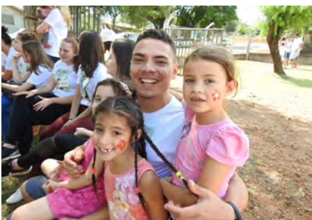
Giovani dal Brasile nel Barrio Fatima.