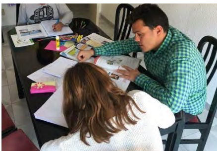
Sostegno scolastico per i bambini