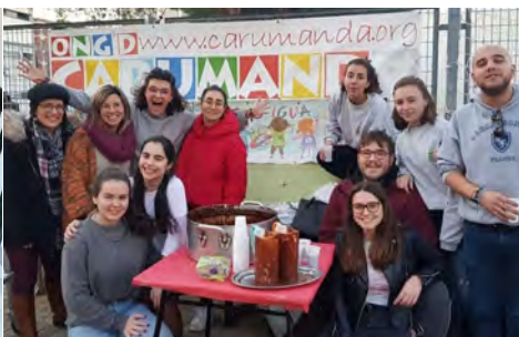
"Chocolatada" per Progetti