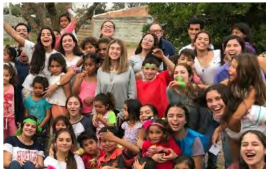
Area picnic e giochi con i bambini