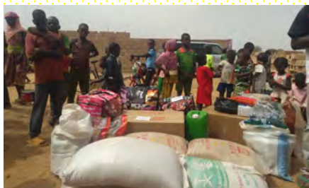
I bambini sfollati con le loro famiglie a causa del terrorismo ricevono donazioni.

A causa della minaccia del terrorismo, circa 700.000 persone hanno dovuto lasciare le loro case e cercare zone più tranquille. I Fratelli e i giovani di JASAFa dei "Piccoli Taborin" stanno aiutando queste famiglie.